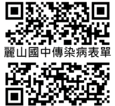
麗山國中傳染病表單